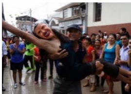
2013-02-12 | Conozca el alucinante carnaval de Rioja