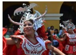
2013-02-09 | Lima: la otra capital de la Candelaria