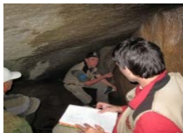
2013-02-09 | Buscando un Inca (con georadar)