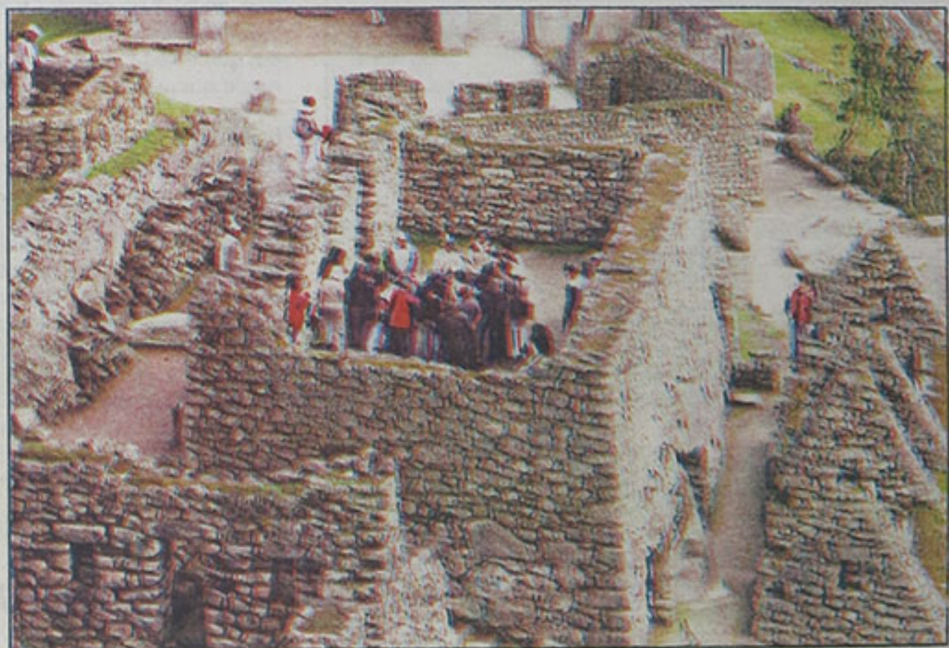
Este recinto se derrumbaría si se hacen las excavaciones que pretende el francés.