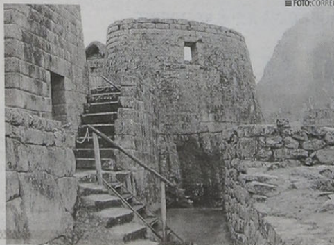
De darse una excavación estructura se debilitaría.

tural, a partir de este monitoreo es que concluyó, sin otro argumento, que bajo el torreón se halla la tumba del más importante gobernante del imperio. "No es posible que haya tal contexto fúnebre porque nunca se hizo excavación alguna que sustente científicamente lo propuesto por Jamin", refirió la entidad cultural. Efectivamente el explorador solicitó un permiso para esta práctica, pero le fue negado. "Sólo el Estado a través del Ministerio de Cultura puede realizar excavaciones en Machupicchu, reconocido como patrimonio de la humanidad", citaron. ■