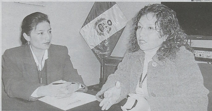
■ SUNAT. Intendente de la institución tributaria confirma deuda millonaria.